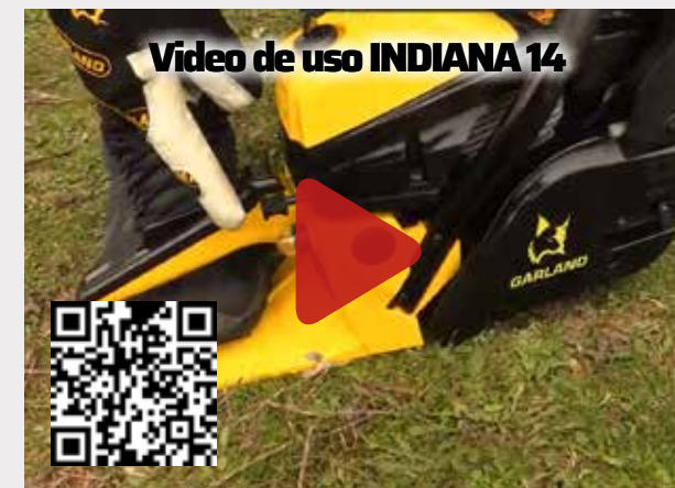
Video de uso INDIANA 14