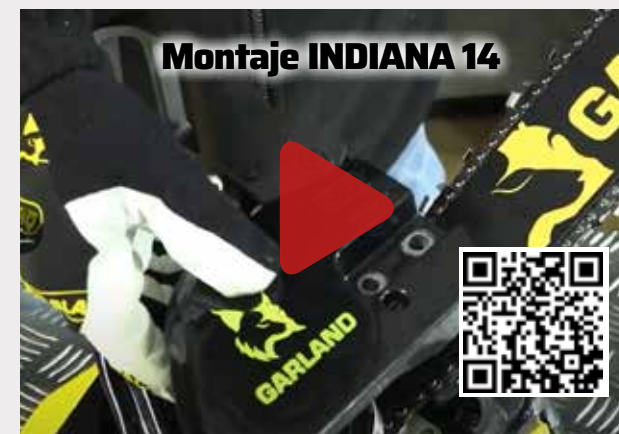
Montaje INDIANA 14